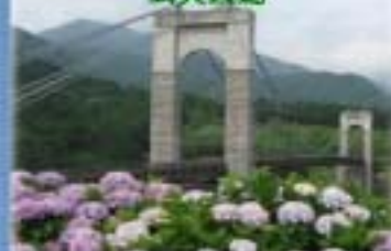
県立秦野戸川公園シンボル 風の吊り橋